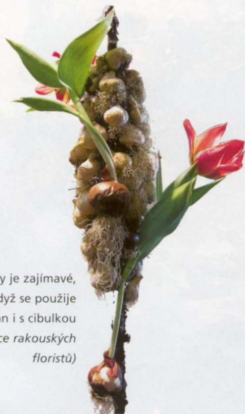
Vždy je zajímavé, když se použije tulipán i s cibulkou (práce rakouských floristů)