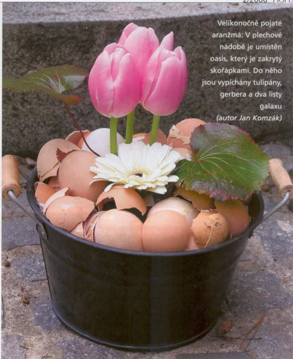
Velikonočně pojaté aranžmá: V plechové nádobě je umístěn oasis, který je zakrytý skořápkami. Do něho jsou vypíchnuty tulipány, gerbera a dva listy galaxu (autor Jan Komzák)

Bez ohledu na zemi svého původu se tulipán stal symbolem Nizozemska. Po stoletích třídění, výběru a šlechtitelského úsilí je nyní možné spatřit tulipány nejrůznějších tvarů, barev a velikostí. Tulipán už dávno není jen žlutý, jak ho ve své době opěvovala písnička v Semaforu. Pěstitelé nabízejí rok od roku stále více barev a tónů. Okvětní lístky jsou kulaté (například odrůda 'White Dream'), špičaté ('Ballerina'), vroubkaté ('Rococo'), jednobarevné i žíhané. Některé květy jsou nádherně uzavřené, jiné zase spíše připomínají lehce rozkvetlé pivoňky.